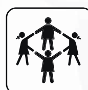
Capacité 8-10 enfants