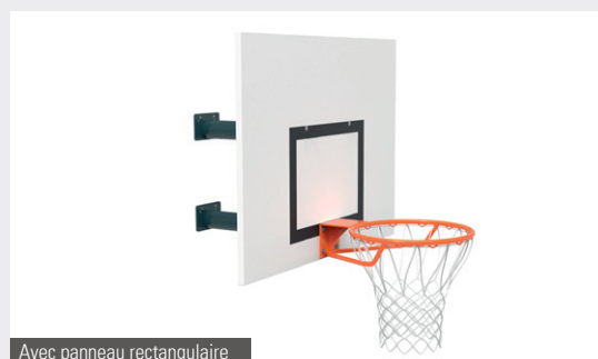
Avec panneau rectangulaire